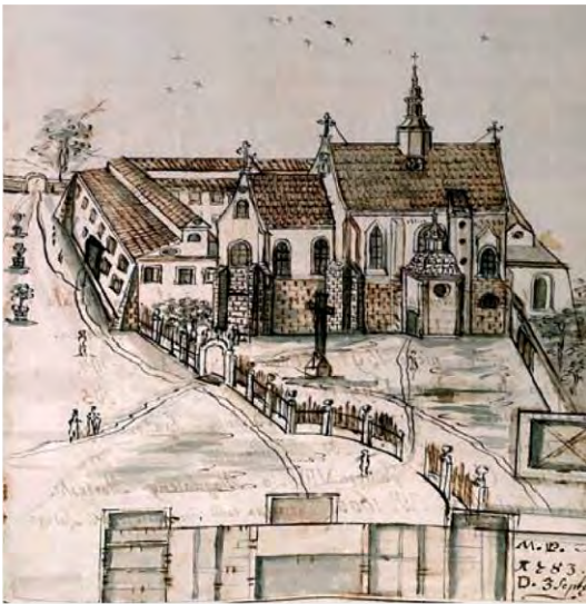
Միանձնուհիներու վանական համալիրը

լատինական Պենետիկիթեան արքայութեանը: Միանձնուհիներու մենաստանի պատրաստութեան համար այս շրջանին համայնքը օգտուած է նուիրատուներու օգնութենէն, անոնց մէջ էին Լվովի Հայ կաթողիկ Արքեպիսկոպոսներ, մեծահարուստ լեհահայեր, Հայ համայնքի հեղինակաւոր պատգամաւորներ եւ ազնուականութիւնը ներկայացնող Հայ ունեւոր խաւը: Լեհահայ միանձնուհիները ունեցած են նաեւ իրենց սեփական ագարակը, հոն կը գտնուէր Ս. Աստուածածնի հայկական մատուռը: