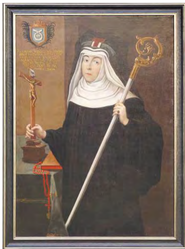
Արքայուհի՝ Մարիանա Քսավերա Ներսէսովիչնա

Ի վերջոյ, լեհահայ կաթողիկ եկեղեցւոյ երկրորդ Առաջնորդի՝ Վ. Յունանեանի օրով 1701 թուականի 20 Յունուարին, Սեֆերովիչ եւ Սբենտովսքի հայկական ընտանիքներու հետ առնչակից, Եազլովիցէի քահանայական ընտանիքի մէջ ծնած միանձնուհին՝ Տ. Ներսէս Ներսէսովիչ քահանայի դուստրը եւ Եպիսկոպոս Պոկտանի քոյրը՝ Մարիանա Քսավերա Ներսէսովիչնան (1625–1710) միաձայնութեամբ կ'ընտրուի լեհահայ միանձնուհիներու առաջին հովուապետուհի: Մեծաւորուհիի այս կոչումը ցմահ կը տրուէր 2 : Առաջին այս Հայ արքայուհին կամ արքամայրը հովուապետած է մինչեւ իր մահը 1710 թուին: Պէտք է յիշել որ, Ներսէսովիչնա արքայուհին եղած է կաթողիկ եկեղեցւոյ հետ միութեան գովաբանող թունդ կողմնակիցներէն եւ դրուատողներէն, Պենետիկթեան միանձնուհիներու իր ուխտը կատարած է 24 Օգոստոս 1683 թուին: