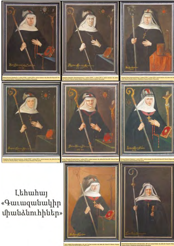
Լեհահայ «Գաւազանակիր միանձնուհիներ»

այլ թանկարժեք մատանիներու կողքին ունէին կուրծքի վանական մեծ խաչը, իսկ հոգեւոր հոգածութեան յատկանիշներն էին՝ վարդարանը ձախ ձեռքին, Աստուածաշունչը եւ խաչեալին օրհնուած խաչը: