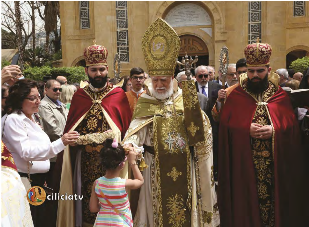
Ս. Ե. Անմահ Պատարագի ընթացքին Վեհափառ Հայրապետը հաւատացեալ ժողովուրդին փոխանցեց հետեւեալ պատգամը: