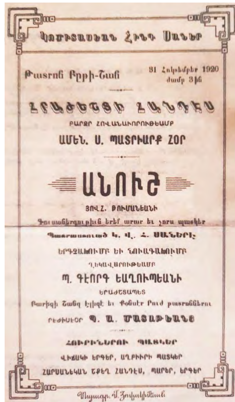
Կոմիտասի սաների «Անուշ» գուսաներգութեան պաստառը

1920 թ. Կոմիտասի սաները մեկնում են Փարիզ երաժշտական կրթութիւն ստանալու նպատակով: Փարիզում Բարսեղ Կանաչեանը ընկերների հետ միասին գիտելիքներ է ստանում երաժշտատեսական առարկաներից, սակայն նախատեսուած երկու տարուայ ուսուցման փոխարէն այնտեղ սովորում է մէկ տարի: