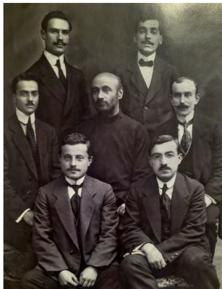
Կոմիտաս Վարդապետի սաները

Այս խումբը որոշակիօրէն սկսել էր անցնել կոմիտասի նախանշած ուղիով: Անգամ ձեւակերպել էր սեփական տարբերանշանը: