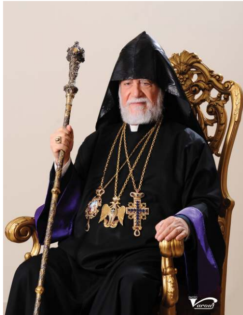
Ն.Ս.Օ.Տ.Տ. ԱՐԱՄ Ա. ԿԱԹՈՂԻԿՈՍ ՄԵԾԻ ՏԱՆՆ ԿԻԼԻԿԻՈՅ